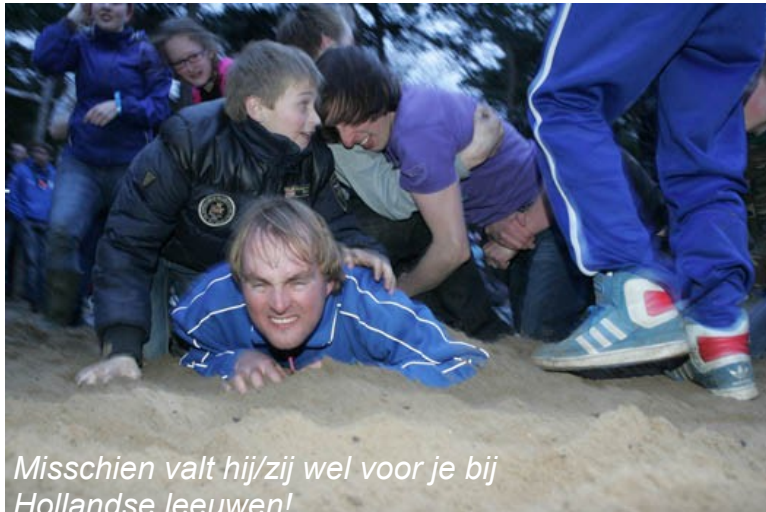
Misschien valt hij/zij wel voor je bij Hollandse leeuwen!