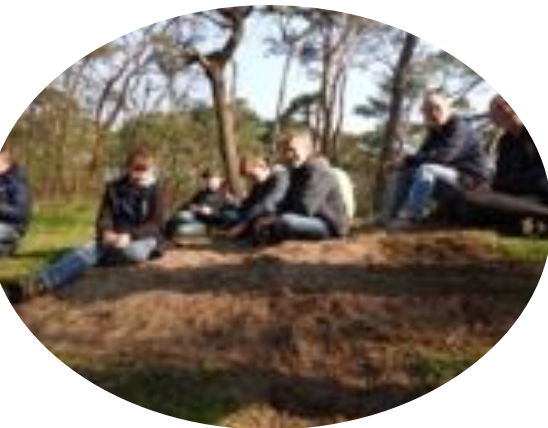
Dit groepje is ook nog op zoek naar relaties!